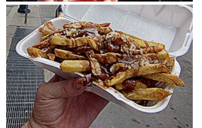
Street Eats. »Ich fotografiere alles, was ich unterwegs esse«.